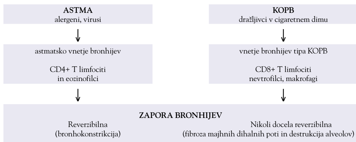
Shema 1: Imunopatogeneza astme in KOPB (6, 7).

Pri napredovali bolezni se pojavi dispneja tudi v mirovanju. Zaradi vpliva vnetnih mediatorjev na meta-