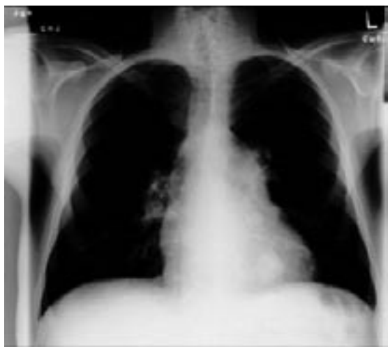
Slika 3: Rentgenogram pri bolniku s KOPB

Značilni sta dve klinični sliki, ki so ju včasih pripisovali pretežno emfizemu ali bronhitisu, danes pa vemo, da sta histološki sliki pljuč enaki. Rožnati pihavec (pink