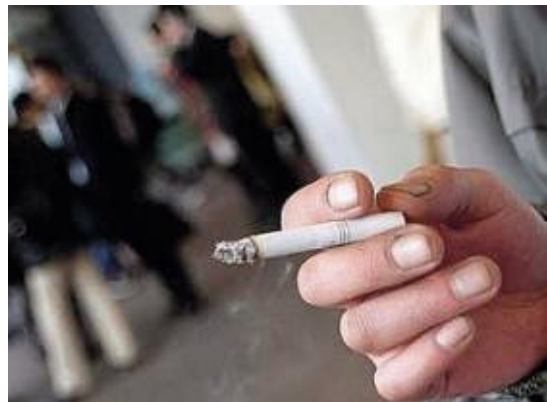
Govorica, da nekaj cigaret na dan ni škodljivih, po trditvah norveških znanstvenikov ne drži. Foto: EPA

Vir: http://www.rtv slo.si/modload.php?&c_mod=r-news&op=sections&func=read&c_menu=18