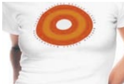
Najpomembnejša je osveščenost žensk, ki se morajo pregledovati tudi in predvsem same.

Uredništvo: Medicinski mesečnik, Splošna bolnišnica Maribor, Ljubljanska 5, 2000 Maribor