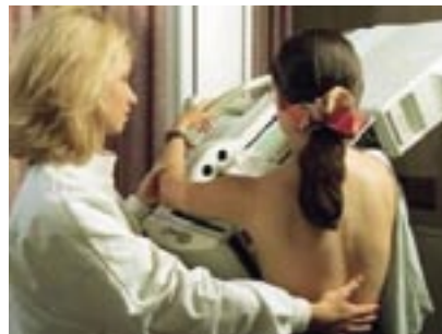
dpa Društva si prizadevajo za vzpostavitev pogojev za zgodnje odkrivanje raka dojk in hitro zdravljenje.

Vir: http://www.rtvlo.si/modload.php?&c_mod=rnews&op=sections&func=read&c_menu=18