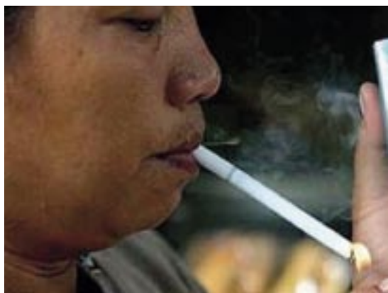
Eno cigatera ali pa cela škatlica na dan je popolnoma enako.