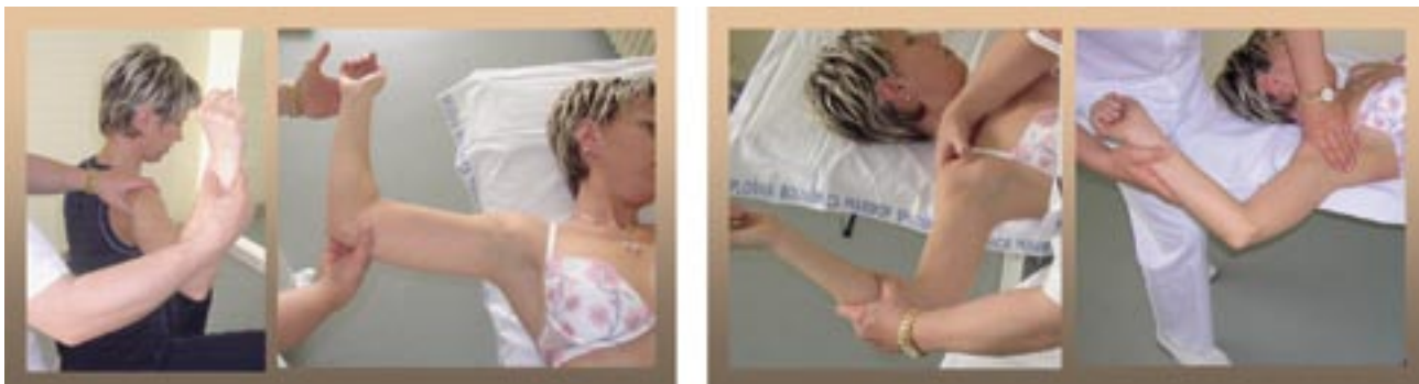
Slika 8. Test samoobrambe (sprednji apprehension test sede/leže) in relokacijski test

Zadnja nestabilnost je predvsem pri popoškodbeni nestabilnosti bistveno redkejša od sprednje, vendar je postavitev prave diagnoze pogosto otežena ( nativni radiogram je negativen, potrebne so posebne projekcije ), tako da se zadnji izpah skoraj v polovici primerov spregleda. Glede na to, da so adduktorji in notranji rotatorji ramena močnejši od abduktorjev in zunanjih rotatorjev, pride pri dorzalni luksaciji do pomika glavice nadlahtnice preko zadnjega roba glenoida, zato je ud blago adduciran, flektiran in notranje rotiran, kar sčasoma privede do zmanjšanja sposobnosti zunanje rotacije ramena. Najpogostejši vzrok zadnje nestabilnosti so ponavljajoče se mikrotravme, ki povzročijo oslabitev zadnjega dela rotatorne manšete, z razvlečenostjo zadnjega dela sklepne ovojnice in subluksacijo glavice. Tudi zadnjo nestabilnost ocenjujemo s testom samoobrambe ( posteriorni apprehension test ) in zadnjim predalčnim fenomenom ( posteriorni Dower test ), le da je smer testiranja pri obeh v