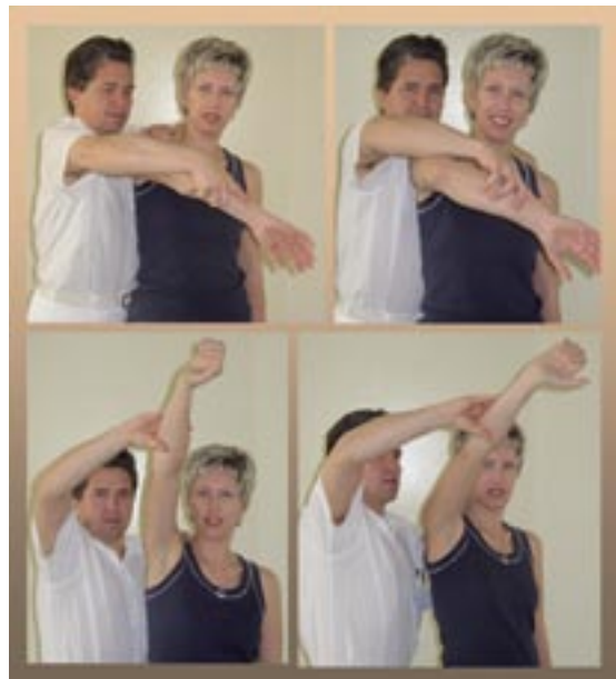
Slika 7a. Hawkins-Kennedy - znak

Sprednja nestabilnost je najbolj pogosti tip glenohumeralne nestabilnosti, ki jo ocenjujemo z testom samoobrambe ( ang. apprehension test ), relokacijskim testom in sprednjim predalčnim testom ( ang. Drower test ). Pri bolnikih brez akutne poškodbe ramena je za oceno nestabilnosti najboljši test preskoka ( ang. load and shift maneuver ). Zadnja nestabilnost testiramo z zadnjim predalčnim testom ( ang. Dower test ), Fukuda testom in testom horizontalne addukcije. Znake