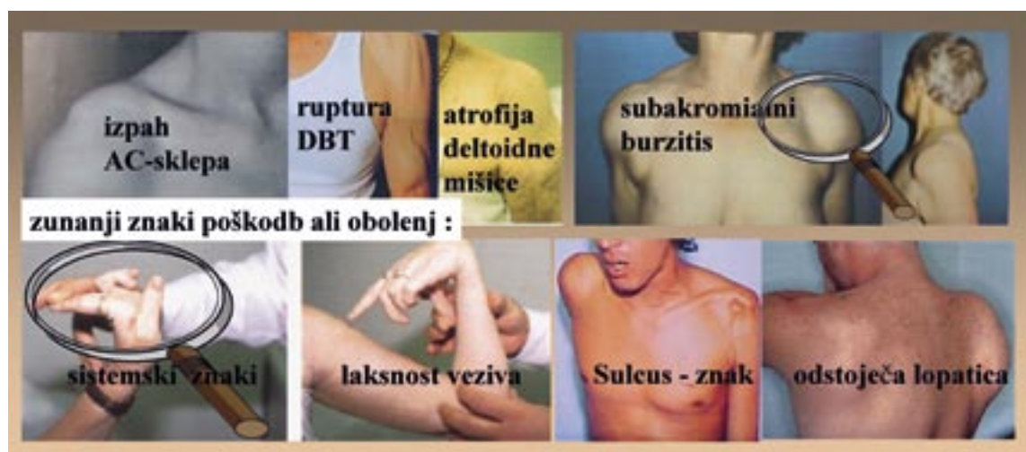
Slika 1. Prikaz tipičnih kliničnih slik, prepoznavnih pri inspekciji ramena, ob oceni kontur in simetrije obrisov, zunanjih znakov poškodb ali predhodnih obolenj.