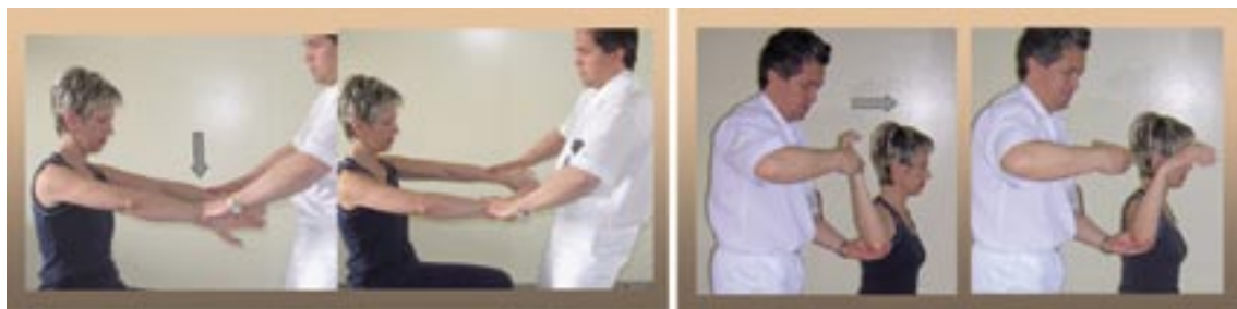
Slika 11: Jobov test (moč supraspinatusa), Vrzel zun. rotacije (moč infrapinatusa)

Pri ocenjevanju bolečine v rami lahko pomagajo tudi diagnostične injekcije lokalnega anestetika po Neeru (slika 14). Običajna mesta vbizgavanja so sprožilna bolečinska mesta, kot sta AC sklep in subakromialni prostor. Injekcije v subakromialno burzo lahko pomagajo pri razmejitvi adhezivnega kapsulitisa, zagozditve in natrganin rotatorne manšete, pri čemer je injekcija učinkovita predvsem ob testu zagozditve. Bolniku z znaki zagozditve ( pozitivni Hawkins in Neerov test ) apliciramo injekcijo 5 do 10 ml 1% lidokaina ( ali 0,5% markaina ) v subakromialno burzo. Pozitiven test predstavlja vsaj 50-odstotno zmanjšanje bolečine pri ponovnem testiranju utesnitve. Podobne injekcije v AC sklep,