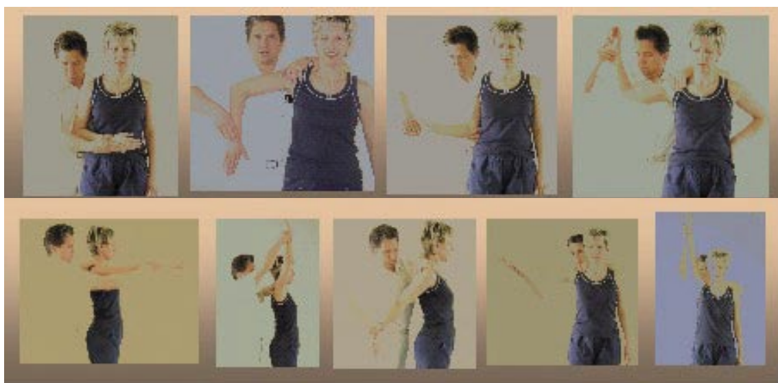
Slika 5. Testi gibljivosti po nevtralni ničelni metodi (antefleksija, abdukcija, rotacije: notranja rotacija (NR) in zunanja rotacija (ZR))