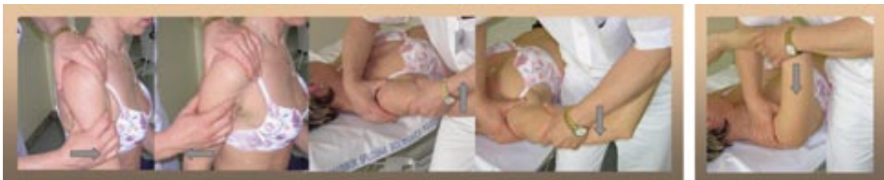
Slika 9. Drower test (sprednji/zadnji sede, sprednji/zadnji leže) in Clunc test (zadnji labrum)