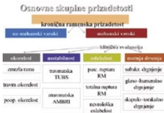
Tabela 1. Osnovne prizadetosti ramena: okorelost, nestabilnost, oslabelost in motnja drsenja (tipi nestabilnosti: TUBS = Trumatic, Unilateral, Bankart lesion, Surgery, AMBRI = Atraumatic, Multidirectional, Bilateral, Rehabilitation, Inferior capsular shift)

Celovit klinični pregled ramena zajema ogled ciljne regije, meritve aktivnega in pasivnega obsega gibov, otip mehkih in kostnih struktur, oceno mišične moči, teste utesnitve, stabilnosti in funkcije mišic ramenskega obroča. Klinični pregled tako sestavlja ogledovanje (inspekcija), otip (palpacija), testi gibljivosti in mišične moči, dodatno pa funkcionalne