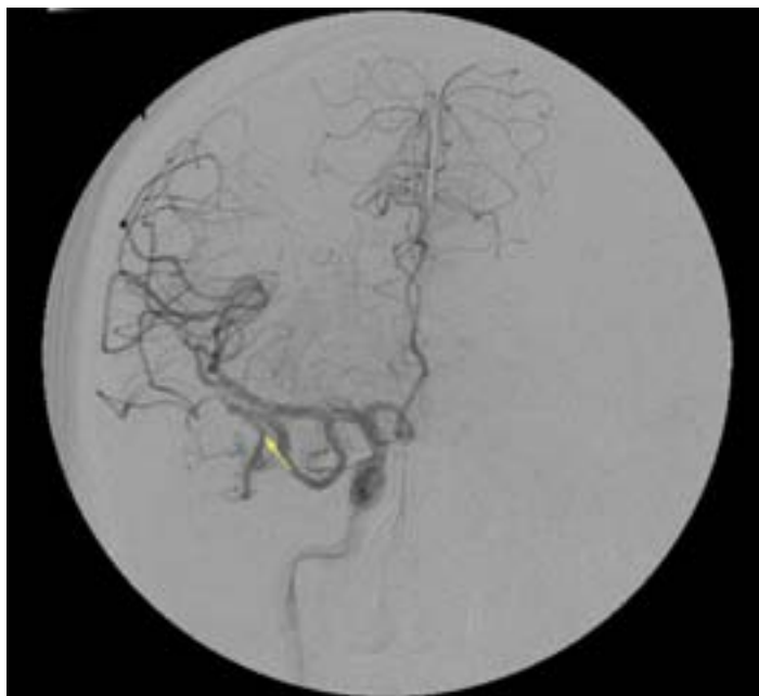
Slika 3: Prikaz desnostranske temporalne AVM z DSA (digitalno subtrakcijsko angiografijo). AVM se polni preko patološko spremenjene arterije, ki izhaja iz desne arterije cerebri medije (puščica). Gre za stanje po obeh embolizacijskih posegih.

Vsekakor želimo to metodo uveljaviti tudi v Sloveniji, vendar smo šele na začetku poti. Večino AVM danes še vedno zdravimo z mikrokirurškim posegom, vsekakor pa bomo morali v Sloveniji uvajati tudi radiokirurgijo, ki bo v povezavi z znotrajžilnimi posegi, predstavljala metodo izbora zdravljenja možganskih AVM.